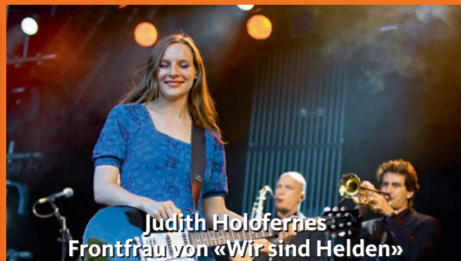
Judith Holofernes Frontfrau von «Wir sind Helden»