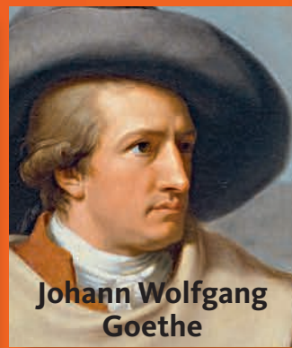
Johann Wolfgang Goethe